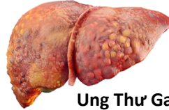
Ung Thư Gan

Ngay cả khi bạn không cảm thấy bệnh, bạn vẫn nên đến gặp bác sĩ/ cố vấn thường xuyên để kiểm tra xem virus có đang ảnh hưởng đến gan hay không. Học cách chăm sóc và giữ cho lá gan của bạn luôn khỏe mạnh.